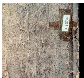
Gambar 4.1 Nomor Naskah Manuskrip

Nomor identitas manuskrip ini tercatat dalam sistem katalog digital KHASTARA: Khazanah Pustaka Nasional dengan kode naskah 20.227M. Penomoran tersebut diberikan secara resmi oleh lembaga pengelola KHASTARA sebagai bagian dari sistem pendataan dan digitalisasi koleksi naskah kuno yang tersimpan di berbagai institusi di Indonesia. Melalui kode ini, setiap manuskrip dapat dikenali secara unik dan mudah dilacak asal-usul serta lembaga penyimpanannya. Dalam konteks penelitian ini, nomor 20.227M merujuk pada manuskrip Al-Qur'an yang berasal dari koleksi Museum Mpu Tantular, Jawa Timur, sebelum kemudian didigitalisasi dan dimasukkan ke dalam pangkalan data KHASTARA oleh Perpustakaan Nasional Republik Indonesia.