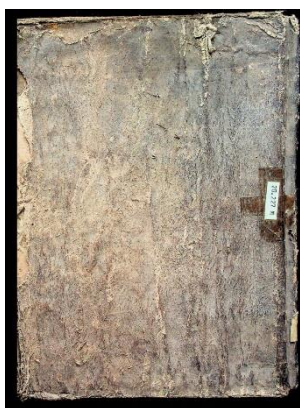
Gambar 3.1 Cover Manuskrip