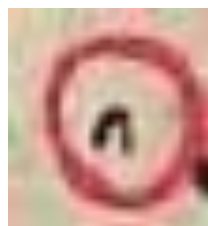
Gambar 7.1, Tanda titik dan bulatan merah tiap akhir ayat

Selanjutnya, pada setiap juz itu memiliki tanda khusus seperti tanda yang bermotif bunga kemudian di cover dengan bulatan merah.