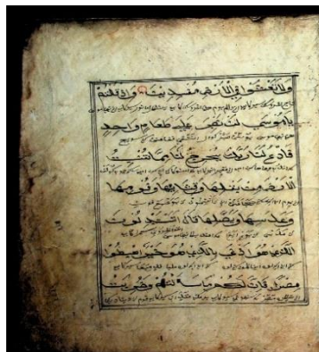
Gambar 2.3 Kondisi Mansukrip terdapat noda hitam