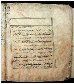
Gambar 6.1 Q.s Al-fatimah, hal. 4, terdapat 6 baris