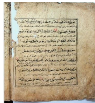
Gambar 2.2 Kondisi Mnauskrip ini mengalami kerobekan di sebelah kiri atas ,sehingga ada beberapa teks yang tidak bisa di baca