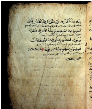
Gambar 6.4 Q.s Ali Imran ayat 92, hal. 175, terdapat 5 baris