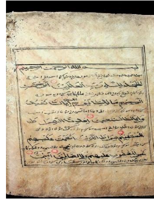
Gambar 1.2 (20.227M.) QS. Al-Fatihah