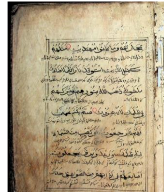
Gambar 6.6 Q.s Al-Baqarah, hal. 9. Mulai dari hal. 6-118, terdapat 7 baris