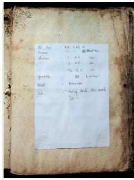
Gambar 5.1 Keterangan Manuskrip