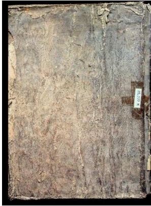
Gambar 1.1, (20.227M.) Cover Mushaf Al-Quran