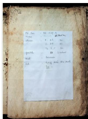
Gambar 3.2 Keterangan manuskrip