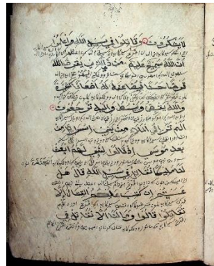
Gambar 6.5 Q.s Al-Baqarah, hal. 123 . Mulai dari hal. 119-146, terdapat 9 baris