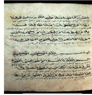
Gambar 6.3 Q.s Al-Ali Imran, hal. 147, terdapat 8 baris