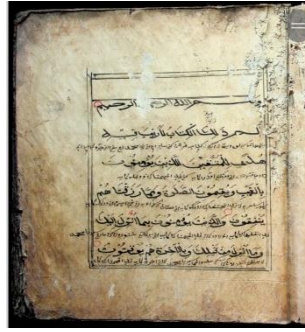
Gambar 6.2 Q.s Al-Baqarah, hal. 5, terdapat 6 baris